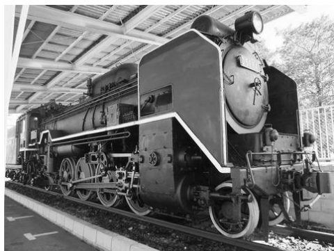
平芝坂の上公園に展示されているSL機関車

ゴーカートコースや建物はなくなりましたが、広い芝生と園内をぐるっと一周できる散歩コースもあり、のんびりとお散歩を楽しめそうです。