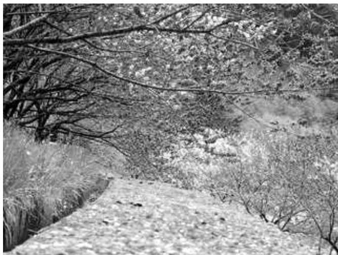
はなもも街道の様子

この美しい景色ができたきっかけは一人の方の思いからでしたが、心安らく気持ち良いことは隣の人、村、町と伝染し広がっています。これから先どこまで広がっていくか楽しみですね。